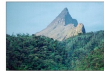
Պիկու դա Նեբլինա լեռ