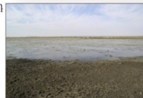
Սար դ Ուրսի լիճ