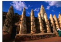
Բորո Դիուլասա. Մեծ մզկիթ