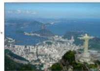
Ռիու դի Ժանեյրո