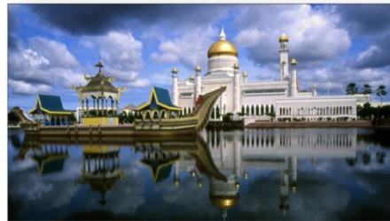
ԲՆԱՆԱՐ ՍԵՐԻ ԲԵԳԱՎԱՆ