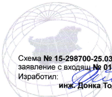
Схема № 15-298700-25.03.2024 г. е издадена въз основа на заявление с входящ № 01-147098-15.03.2024 г.