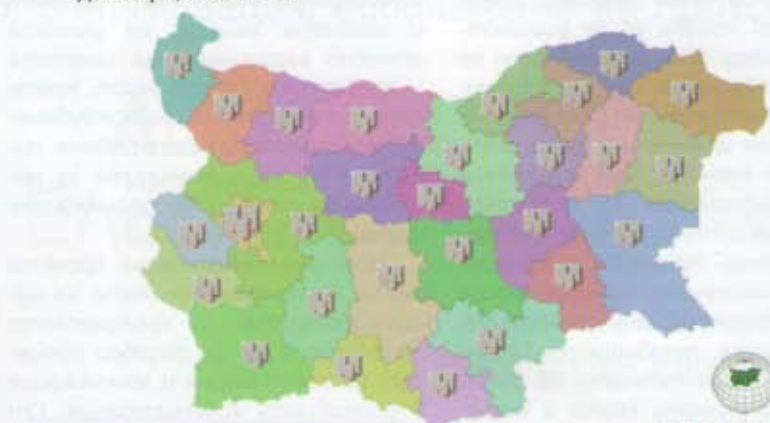
АГЕНЦИЯ ПО ГЕОДЕЗИЯ, КАРТОГРАФИЯ И КАДАСТЪР

Проектът ще започне с анализ на начина за предоставяне на административните услуги от кадастралната карта и регистри. Ще се осигури възможност всяка от тези услуги да бъде заявявана и получавана по електронен път. При оптимизацията на работните процеси специално внимание ще се обърне на нуждите на хората с уврежда-