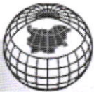
СХЕМА - ПРОЕКТ